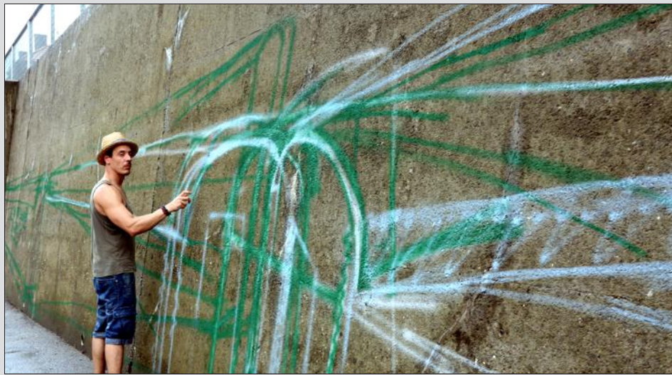
Le Longovicien Pierre Bertolotti entame une commande pour la municipalité : un graffiti de 400 mètres de long, rue de Longwy à Rehon.