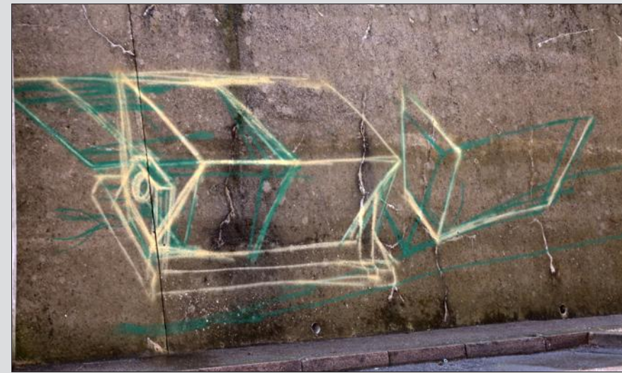
L'artiste graffeur a déjà esquissé le croquis de la future fresque... Deux à trois mois de travail seront nécessaires pour finaliser l'œuvre.