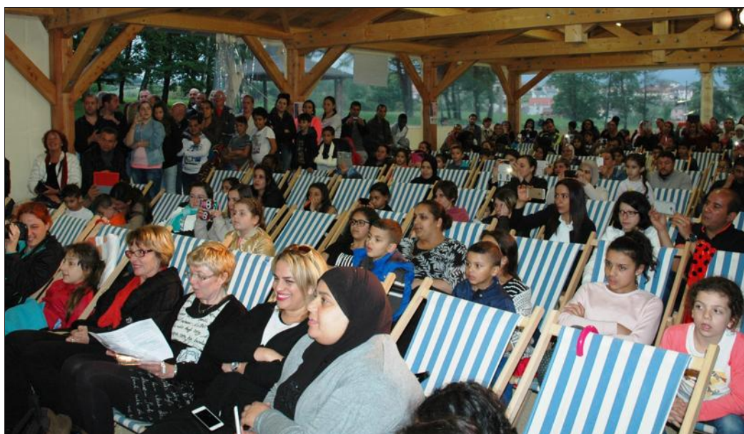
Un public nombreux s'était rassemblé sous la halle du parc Brigid pour le début du festival de contes.

L'éducation et la culture sont des piliers fondamentaux de la formation citoyenne et le public doit profiter pleinement de cette thérapie culturelle, être à l'écoute sans modération de ces conteurs professionnels ou amateurs, tout en étant bien calé dans une chaise longue qui appelle déjà au farniente des prochaines vacances.