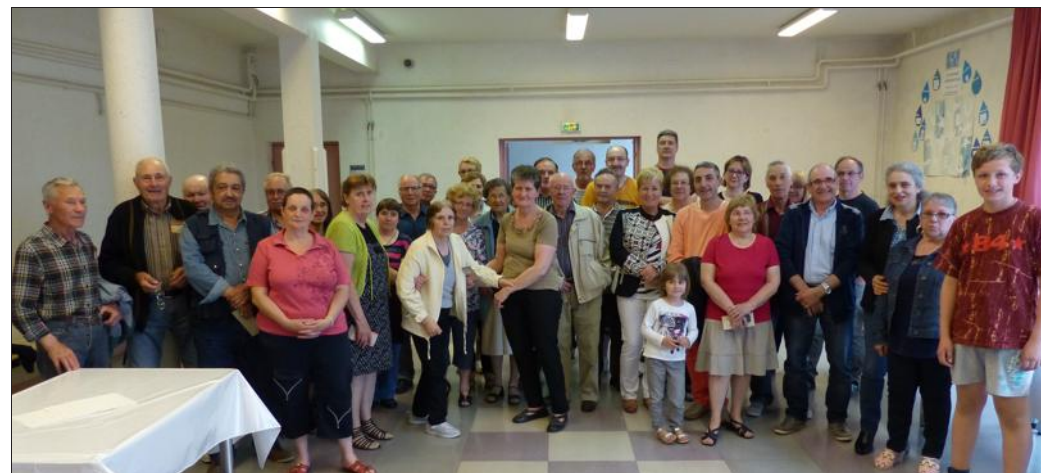
Quelque 70 personnes ont été récompensées pour leurs efforts de fleurissement.

Une abondante remise des prix a eu lieu pour le fleurissement du village. Quelque 70 personnes ont été récompensées pour leurs efforts durant l'année 2015. Des bons d'achat valables chez Thill d'une valeur comprise entre 10 et 25 € ont été offerts.