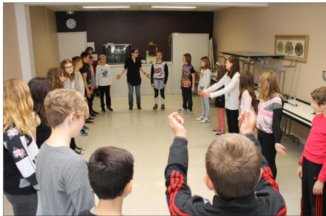
Un des groupes d'actuels ou futurs collégiens est en plein travail.

Après la représentation, un troisième temps de l'opération s'est déroulé avec la constitution de groupes de parole où chacun a pu se remémorer le spectacle, le décrire et exprimer son ressenti et, bien entendu, en tirer des conclusions. Un joli cours sur le théâtre,