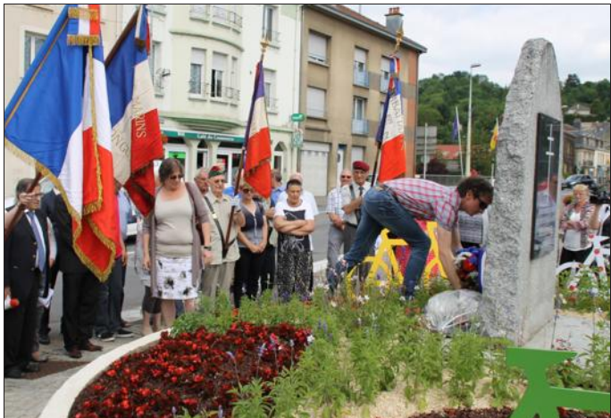
Deux gerbes ont été déposées au pied de la stèle.