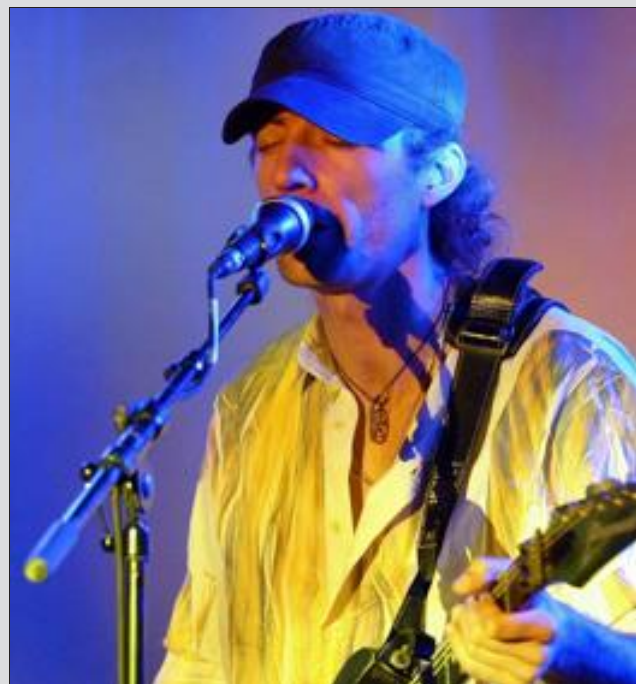
Sterpi sera en clôture de la fête de la musique.

La fête de la musique, organisée par le foyer d'éducation populaire de Cosnes-et-Romain aura lieu le samedi 15 juin à la salle polyvalente de Cosnes-et-Romain.