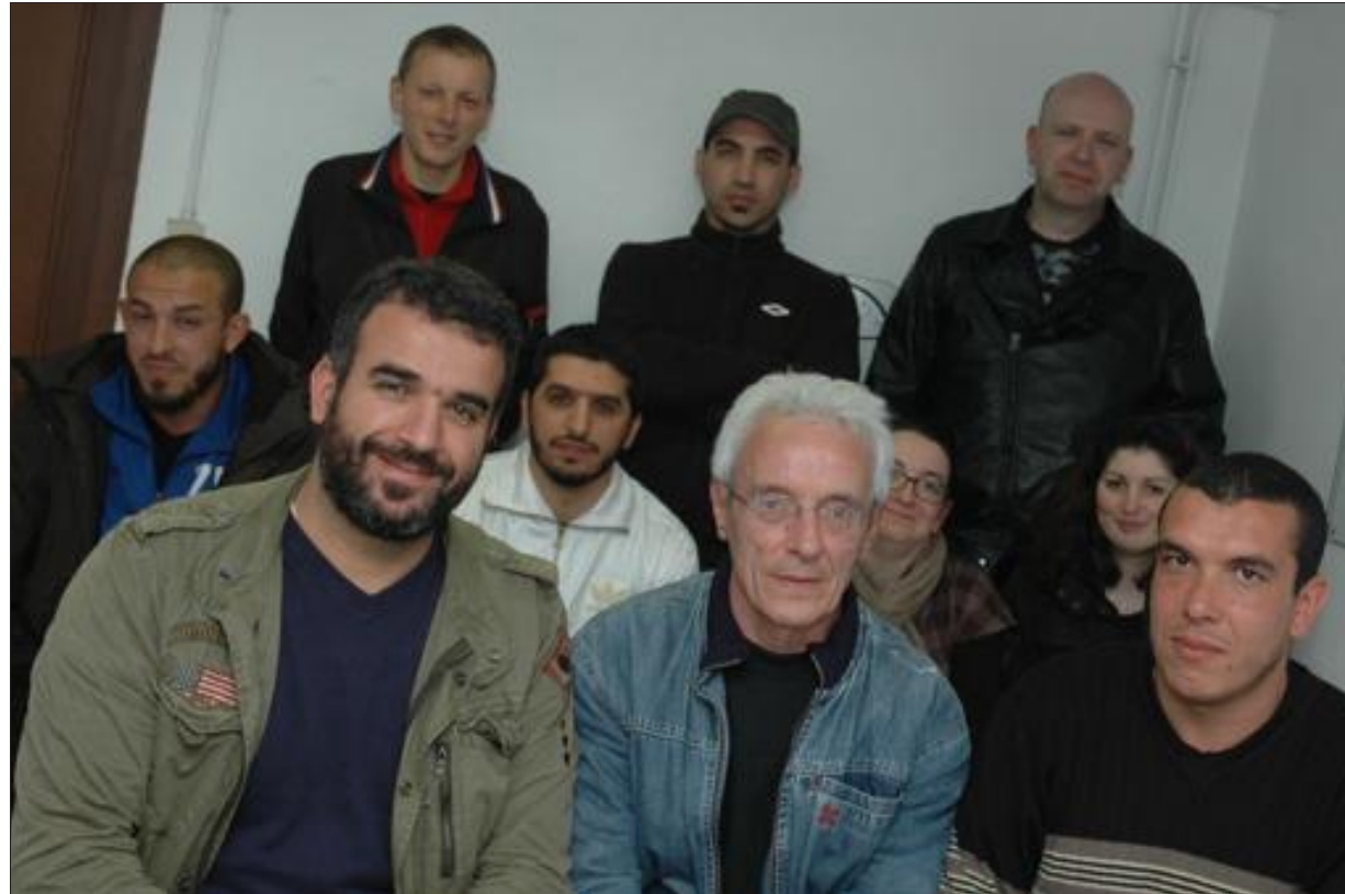
L'USLM football s'est mise au service de l'association pour vaincre l'autisme.

Cette association créée pour vaincre l'autisme mène des actions visant à améliorer le quotidien des familles confrontées à l'autisme ou aux