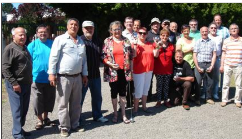
Un concours de pétanque, un loto et une belote ont animé la journée.

Plein succès pour la journée organisée par le comité de l'association Loisirs solidarité retraités (ALSRL) de Gorcy puisque 120 personnes ont répondu à leur invitation.