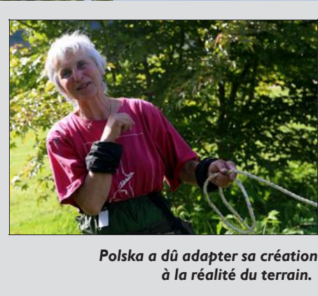
Polska a dû adapter sa création à la réalité du terrain.