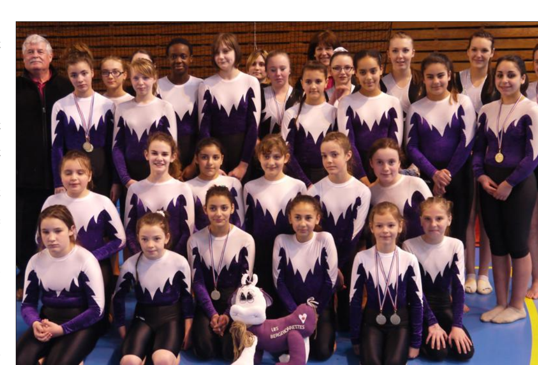
Les gymnastes rehonaises ont assuré de belles performances à domicile.

CUTRY Conseil municipal Le conseil municipal se réunira mardi 26 mai, à 20h en mairie. À l'ordre du jour figurent : les dotations d'investissement transitoire et de solidarité du conseil départemental ; l'inscription des autorisations du droit des sols ; la location d'un appartement communal ; la demande de subvention au titre de la DETR ; la modification du tableau des emplois ; la vente de terrain ; et le projet d'aménagement et de développement durable du PLU. Les questions diverses concluront la séance.