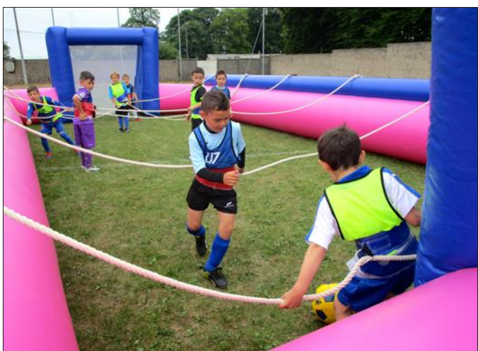
Le baby-foot géant a attiré les adultes et les enfants, impatients de découvrir cette pratique innovante du ballon.

Buvette et restauration ont fonctionné tout le week-end.