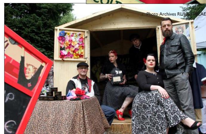
Barbiers d'époque et pin-up : bienvenue dans l'Amérique des années 60.

Pour plus d'informations : www.crybabycarshow.com Aujourd'hui et demain à Rédange. Entrée 18 € pour le week-end, 13 € pour une journée, gratuit pour les moins de 12 ans.