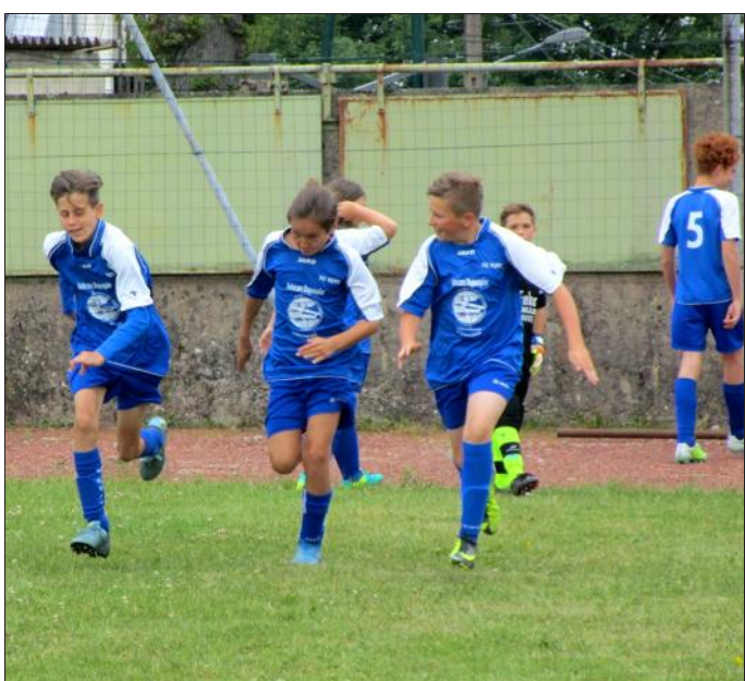
Les équipes U13 étaient bien décidées à remporter leur match. Les jeunes se sont bien échauffés à l'extérieur du terrain avant leur rentrée sur la pelouse.