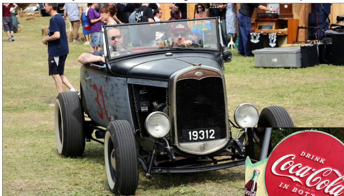
Plus de deux cents voitures Kustom et Hot Rods sont attendues à Rédange ce week-end.

Car le rassemblement s'est spécialisé dans les voitures datant d'avant 1965. Non pas par élitisme, mais parce qu'il n'existait pas de rendez-vous de ce type dans le secteur.