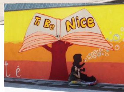
La fresque rend hommage aux victimes de l'attentat de Nice.

L'opération est subventionnée par la Ville, l'Etat, la communauté d'agglomération de Longwy (fonds politique de la ville) et le conseil départemental de Meurthe-et-Moselle.