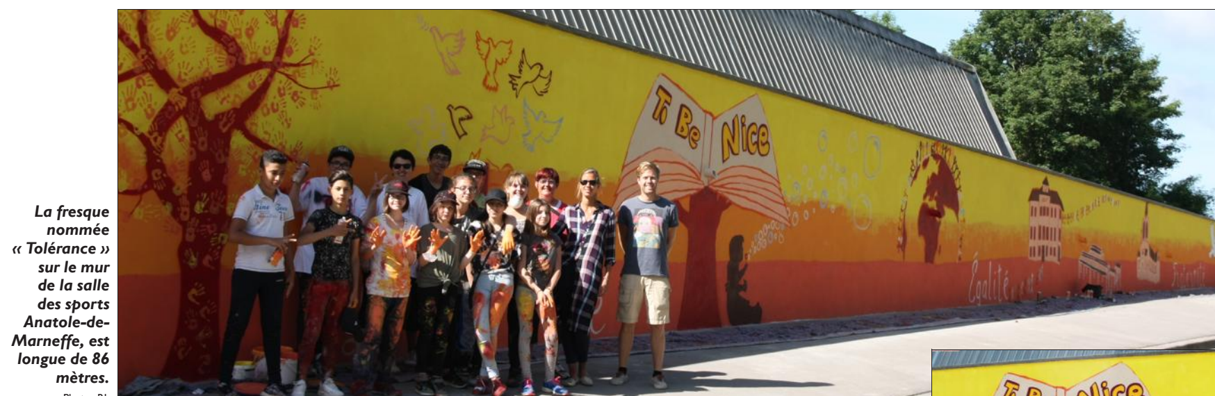
La fresque nommée « Tolérance » sur le mur de la salle des sports Anatole-de-Marneffe, est longue de 86 mètres.