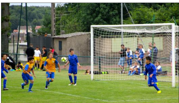
Des challenges, des tournois et des matchs amicaux se sont déroulés sans interruption au stade Delaune.

Les 24 heures de football organisés par l'Entente sportive Villerupt-Thil (ESVT) est une manifestation bien prisée par les amateurs de ballon rond et les autres. L'ambiance est bon enfant, on y vient pour passer un bon moment en toute convivialité. Elle a aussi le mérite de faire découvrir le dynamisme du club qui a organisé sans fausse note les animations prévues.