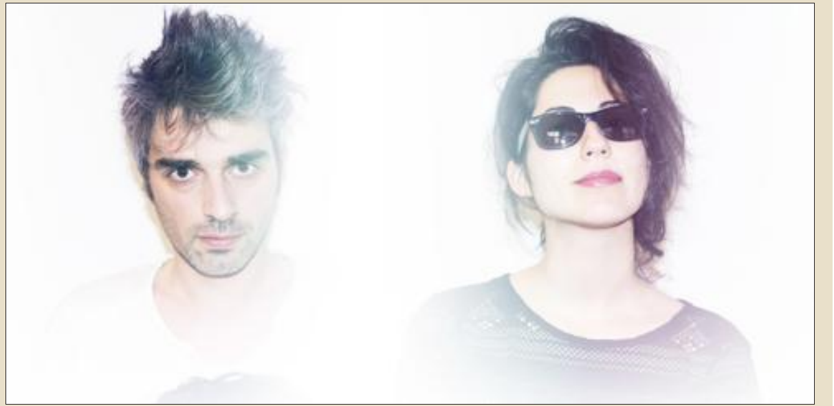
L'énergie du duo Soldout sera à découvrir vendredi 1 er juin à Arlon.

C'est une soirée électro qui propose L'Entrepôt d'Arlon ce vendredi 1 er juin dès 20h30, au palais de la ville.