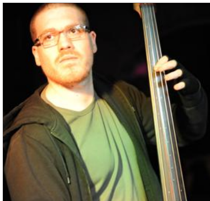
Vendredi soir, La Bonne Filières Evénements accueille quatre groupes, dont Duo d'Icare.

La soirée va être chaude vendredi 25 mai dès 20h30, salle de la Chapelle à La Bonne Filières événements, avec la présence assurée d'au moins quatre groupes... et des surprises. Allez, un petit indice : la sortie de la compilation Longwy city rockers pourrait se faire officiellement ce jour-là, la soirée étant en partenariat avec l'association des utilisateurs du centre social Blanche-Haye de Longwy.