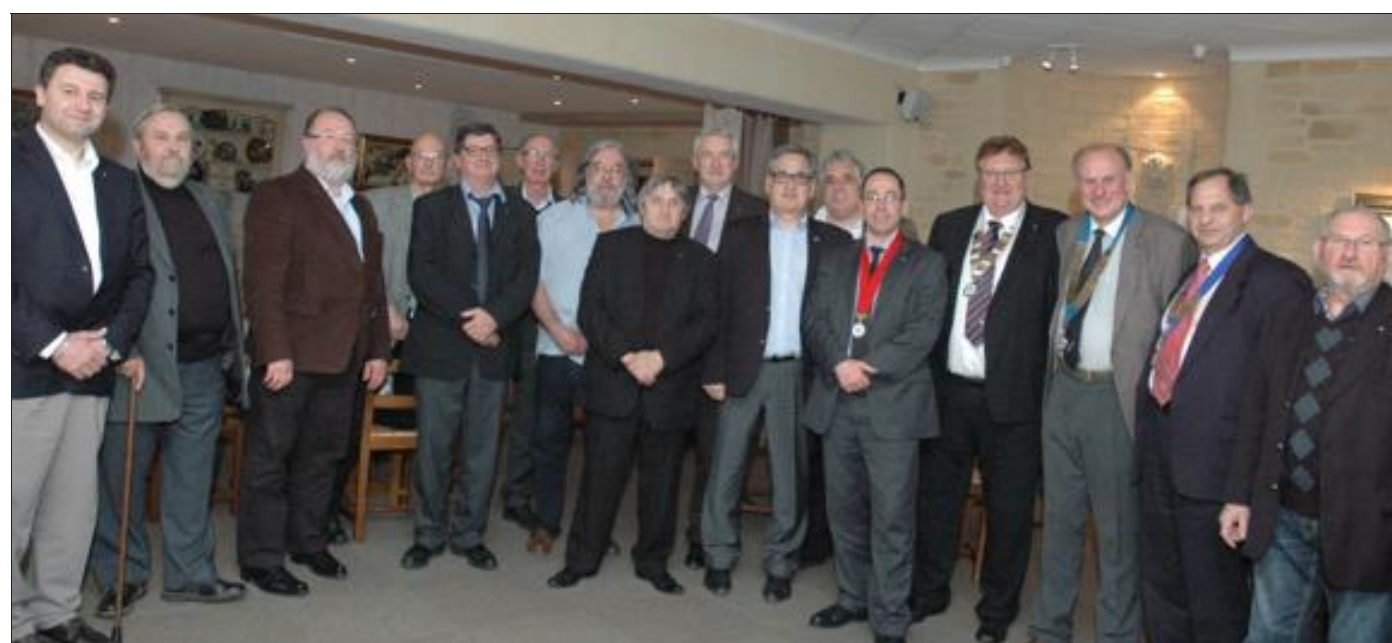
Deux nouveaux membres viennent grossir les rangs des Clubs 41 français de Longwy et de Longuyon.

Le Club 41 français est membre du Quatalagor, entité