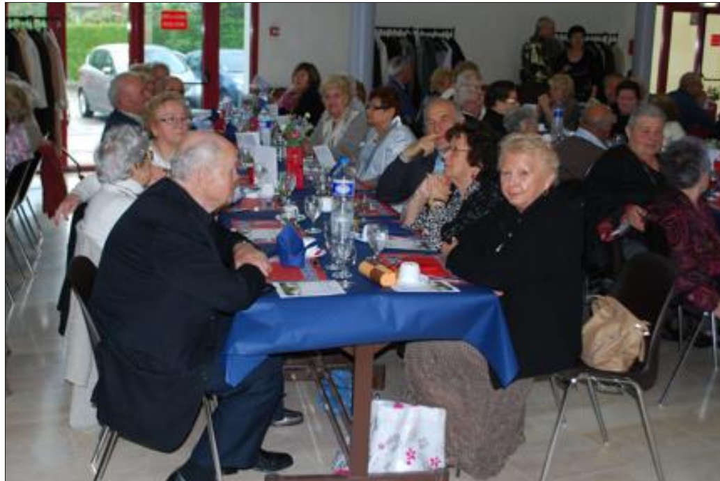
Les membres de l'Arpa ont fêté les soixante ans de la structure.

Le club chant de l'Arpa inter-préta quelques refrains dont